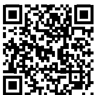
VÍDEO: La preparación de la Navidad en los #ColegiosHHCC

Hijas de la Caridad @HijasCaridadEC · 22 dic. ¡En los #ColegiosHHCC nos preparamos para celebrar la Navidad! Desde la #luz ✨ presente en la sencillez y ternura de un Niño, ojalá seamos personas-estrella ✨ que iluminan, ofreciendo la certeza de la Buena Noticia al mundo 🌍 ¡Feliz y luminosa Navidad! #EducacionVicenciana