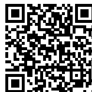
VÍDEO: Villancico en las #ObrasSocialesHHCC