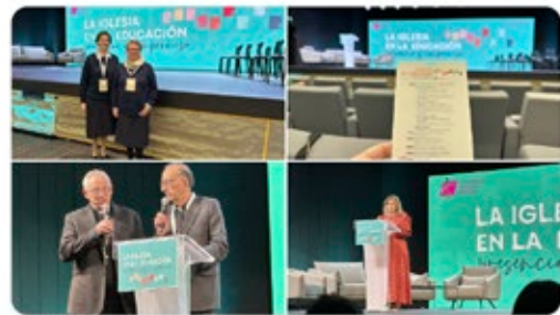
Card. Juan José Omella y 7 más

Estamos presentes en el #Congreso2024 #LaIglesiaenlaEducación. Una iniciativa de @episcopaleycc @Confepiscopal, punto de partida para renovar el compromiso de la Iglesia con la Educación. "La educación es un acto de esperanza para renovar la sociedad". @Pontifex_es