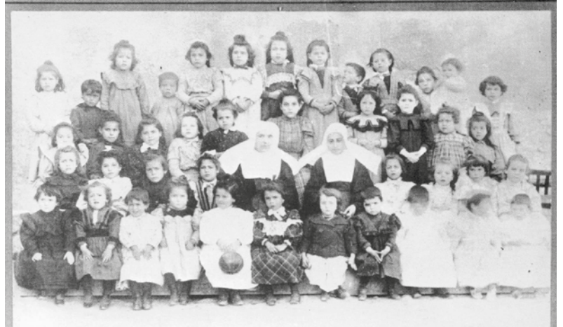
Fotografía del año 1900

Las Hermanas que aquí residen continúan su labor de evangelización y servicio en Valdemoro con la visita domiciliaria, la catequesis en la parroquia y la visita a los ancianos en diferentes residencias. El ocaso de su vida no es señal de baja exigencia en su vocación y fe, todo lo contrario, siguen siendo luz en medio de Valdemoro.