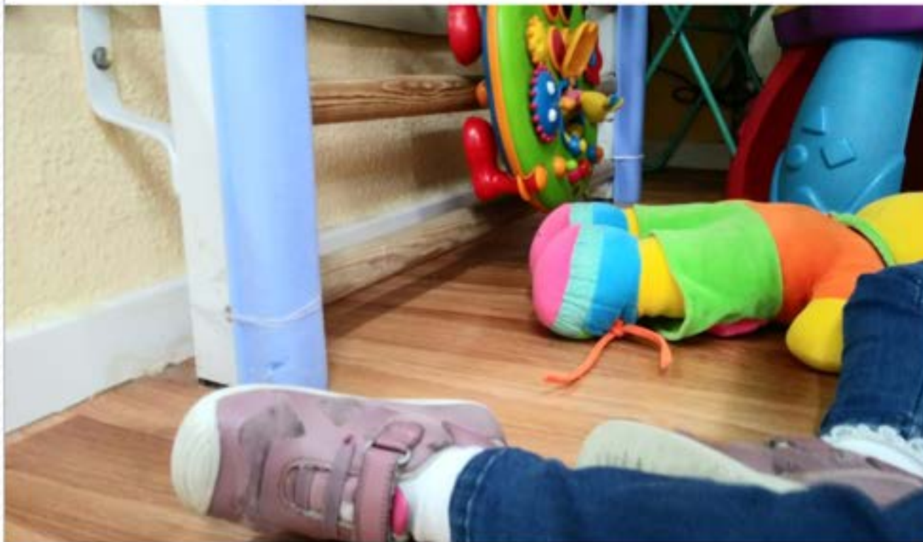
La Casa de Belén acoge a menores de 0 a 6 años. Foto: Begoña

Begoña Aragonesez | 13 de Octubre de 2022