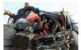
La foto La otra operación retorno