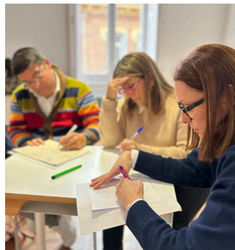
La vida como vocación, encuentro interprovincial de Pastoral