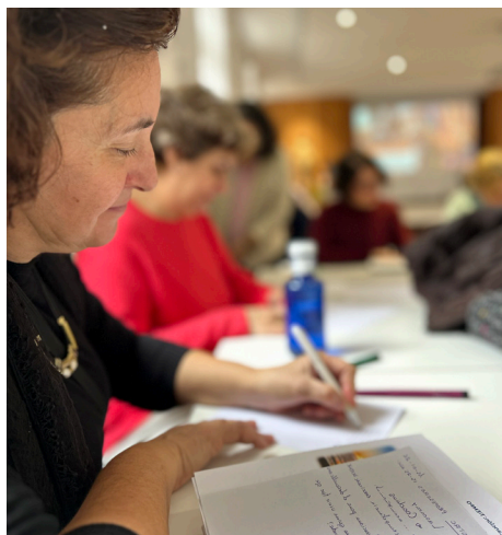
Un alto en el camino, encuentro de Profesores de 15-25 años de antigüedad